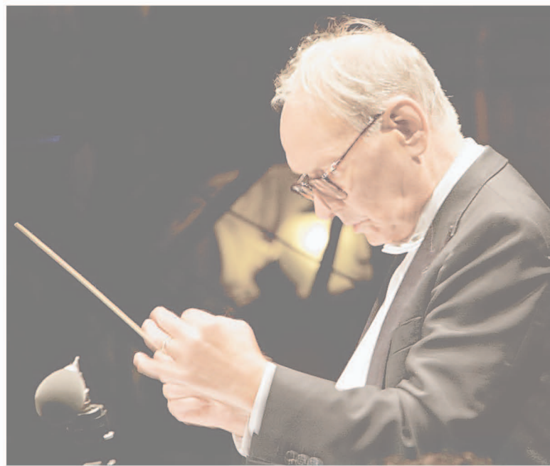
Композитор Эннио Морриконе отлично чувствует себя за дирижерским пультом

Вопреки расхожему мнению, Морриконе создавал не только саундтреки, он писал и камерную инструментальную музыку, с которой в 1985 году даже совершил тур по Европе, лично дирижуя оркестром. Дважды за свою карьеру Эннио Морриконе сам снимался в фильмах, к которым он писал музыку, а в 1995 году про маэстро был снят целый документальный фильм.